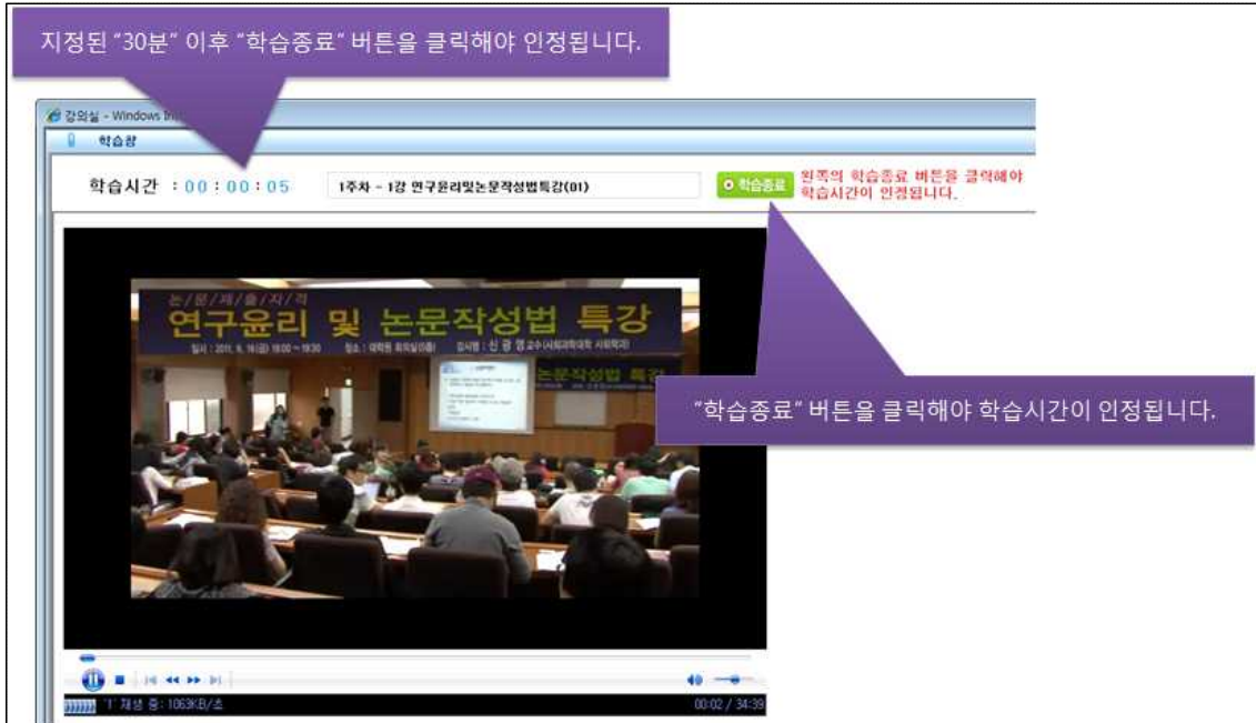
[ ‘강의보기’ 클릭 후 동영상 시청 화면 ]