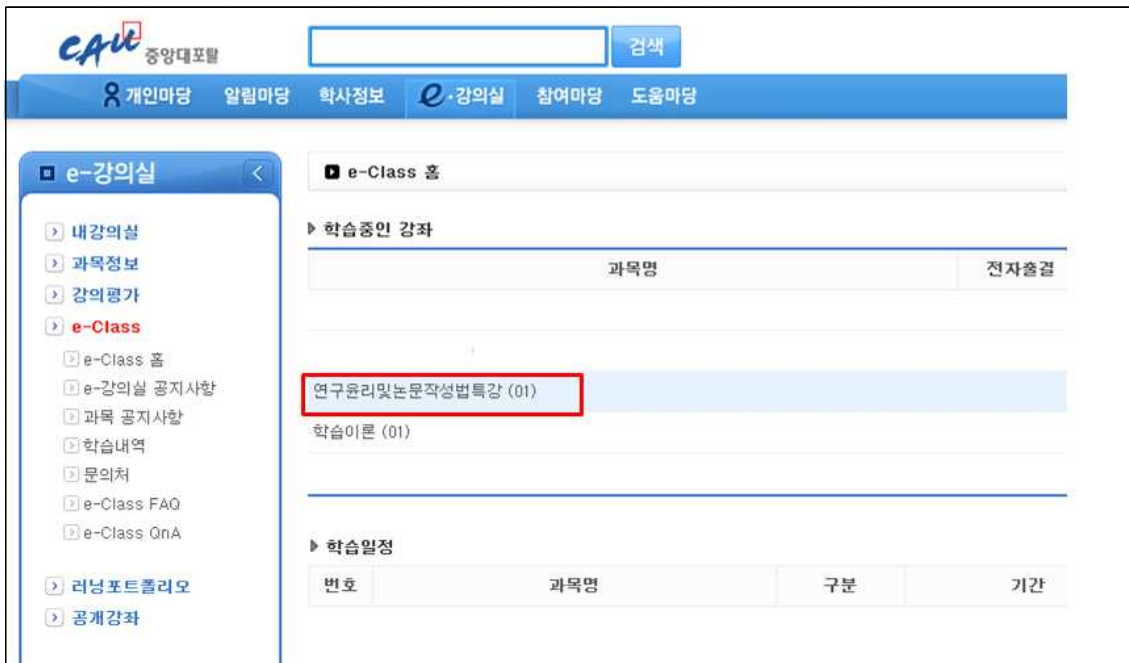
[ e-Class 홈 화면 ]