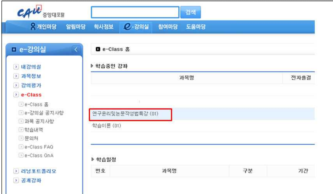
[ e-Class 홈 화면 ]