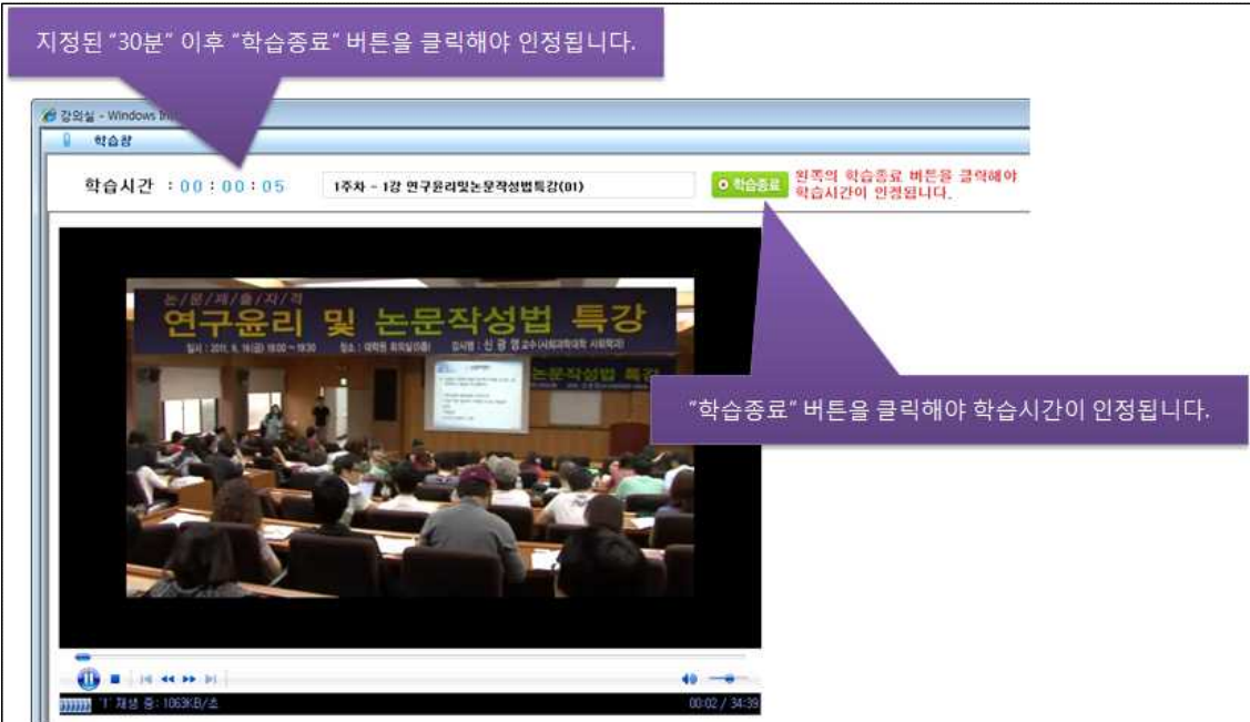
[ '강의보기' 클릭 후 동영상 시청 화면 ]